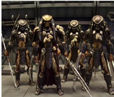
escouade de guerriers d'élite