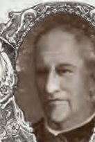
STARRET, DOCTOR HORACE

Es un experto hechicero, que lleva siglos sirviendo al mal y que ha sido enviado por Cthulhu a adquirir Los siete libros cripticos de Hsan . Actualmente reside en Shanghá, en casa de Ho Fong.