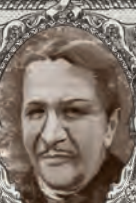
VANE, SIR ARTHUR

Heredero varón del título y de las propiedades de la noble familia Vane, hijo de sir Arthur y hermano de Eloise. Varios vecinos de Lesser-Edale sospechan que él es en realidad la bestia del condado.